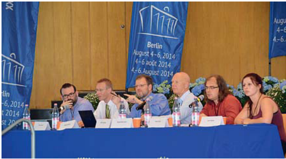
Wem nützt es, wenn die Maschine besser wird? Hochkarätiges Podium zum Thema Mensch&Maschine