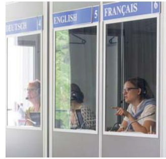
Ein großes „Danke“ dem ehrenamtlichen Dolmetscherteam